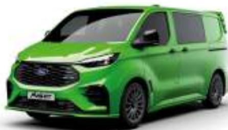
YELLOW GREEN - LAKIER SVO

Dla wersji TREND dostępny tylko z napędem elektrycznym