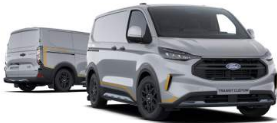
Ford Transit Custom VAN L1 w wersji TRAIL z lakierem zwykłym -specjalnym Grey Matter (opcja)