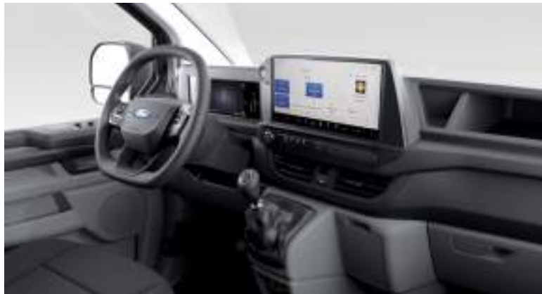
Ford Transit Custom VAN w wersji Trend z manualną skrzynią biegów i tapicerką materiałową - ciemną (standard)