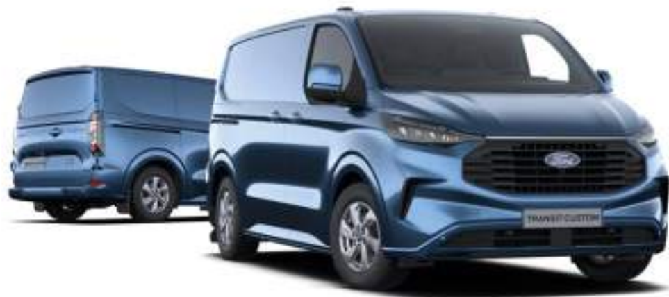
Ford Transit Custom VAN L1 w wersji LIMITED z lakierem metalizowany Chrome Blue (opcja)