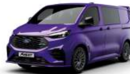
ENW PURPLE - LAKIER SVO

2 500 zł | lakier dostępny tylko dla wersji TREND i MS-RT