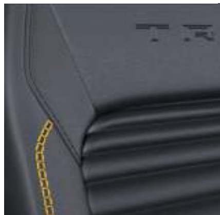
Ford Transit Custom VAN w wersji TRAIL z automatyczną skrzynią biegów i tapicerką częściowo skórzaną (Sensico) w stylizacji TRAIL - z żółtymi akcentami (standard)