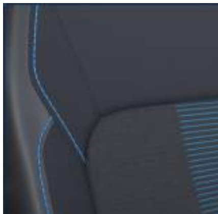
Ford Transit Custom VAN w wersji Sport z automatyczną skrzynią biegów i tapicerką częściowo skórzaną (Sensico) z niebieskimi akcentami (standard)