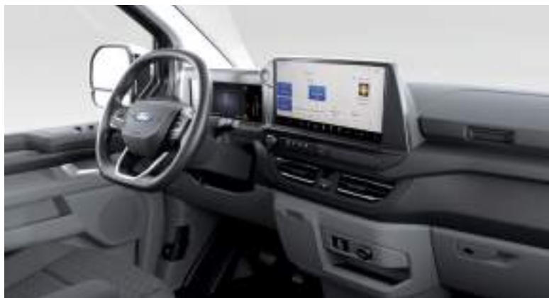
Ford Transit Custom VAN L1 w wersji LIMITED z automatyczną skrzynią biegów i tapicerką materiałową - ciemną (standard)