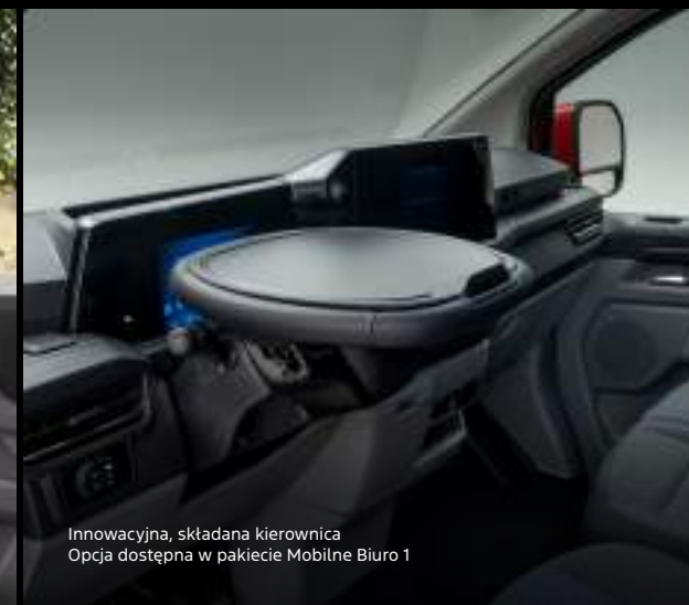
Innowacyjna, składana kierownica Opcja dostępna w pakiecie Mobilne Biuro 1

Ford Transit Custom VAN w wersji LIMITED z manualną skrzynią biegów, z opcjonalnym wyposażeniem