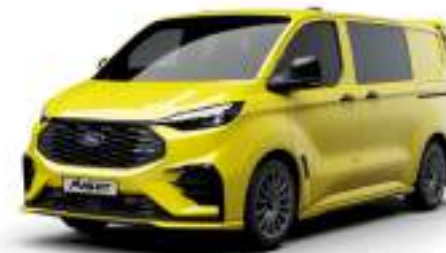
CADMIUM YELLOW - LAKIER SVO

2 500 zł | lakier dostępny tylko dla wersji TREND i MS-RT