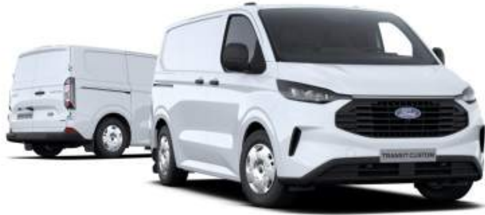
Ford Transit Custom VAN L1 w wersji Trend z lakierem zwykłym Frozen White (bez dopłaty)