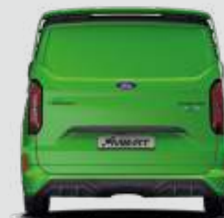
2148 mm (ZE ZŁOŻONYMI LUSTERKAMI)