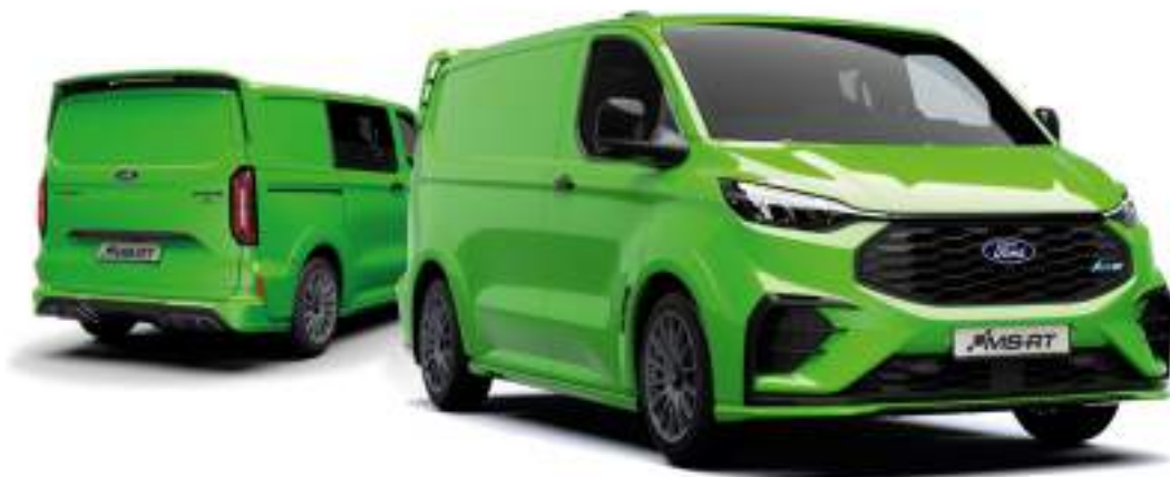
Ford Transit Custom VAN w wersji MS-RT z opcjonalnym wyposażeniem (unoszona tylna klapa) oraz lakierem specjalnym Yellow Green (opcja)