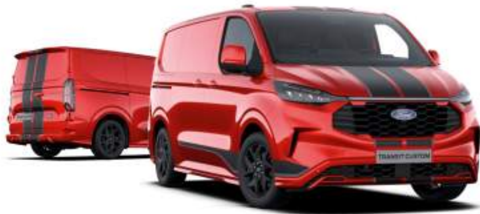
Ford Transit Custom VAN w wersji Sport z lakierem metalizowanym Artisan Red (opcja)