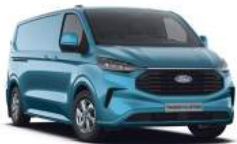
DIGITAL AQUA BLUE - LAKIER METALIZOWANY

2 750 zł | lakier niedostępny dla wersji TRAIL.