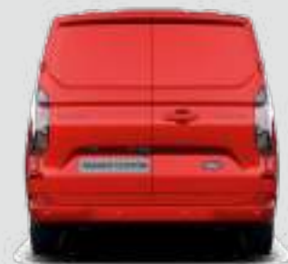
2040 - 2148 mm (ZE ZŁOŻONYMI LUSTERKAMI)