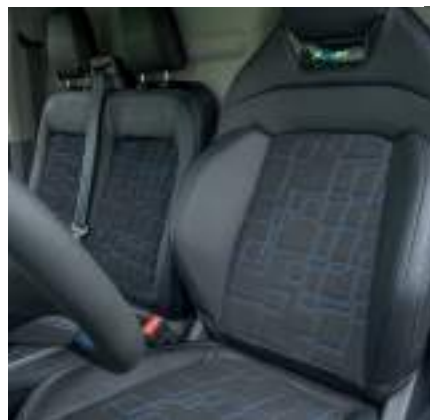
Ford Transit Custom VAN w wersji MS-RT z automatyczną skrzynią biegów i tapicerką częściowo skórzaną, połączone z zamsem (standard)