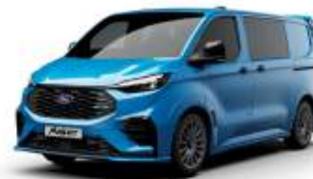
MS-RT BLUE - LAKIER SVO

2 500 zł | lakier dostępny tylko dla wersji TREND i MS-RT