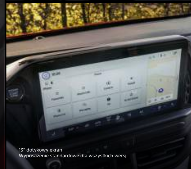
13" dotykowy ekran Wyposażenie standardowe dla wszystkich wersji