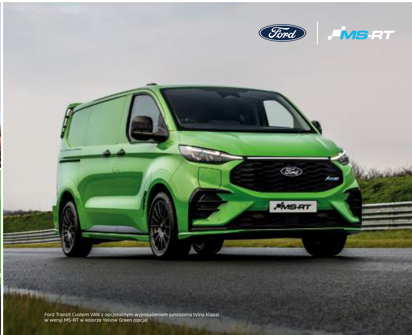
Ford Transit Custom VAN z opcjonalnym wyposażeniem (unoszona tylna klapa) w wersji MS-RT w kolorze Yellow Green (opcja)