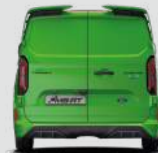
2275 mm (Z LUSTERKAMI)